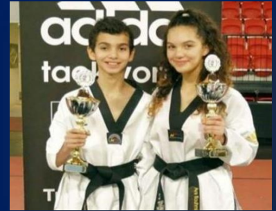
riad en aya bouhmida, taekwondo